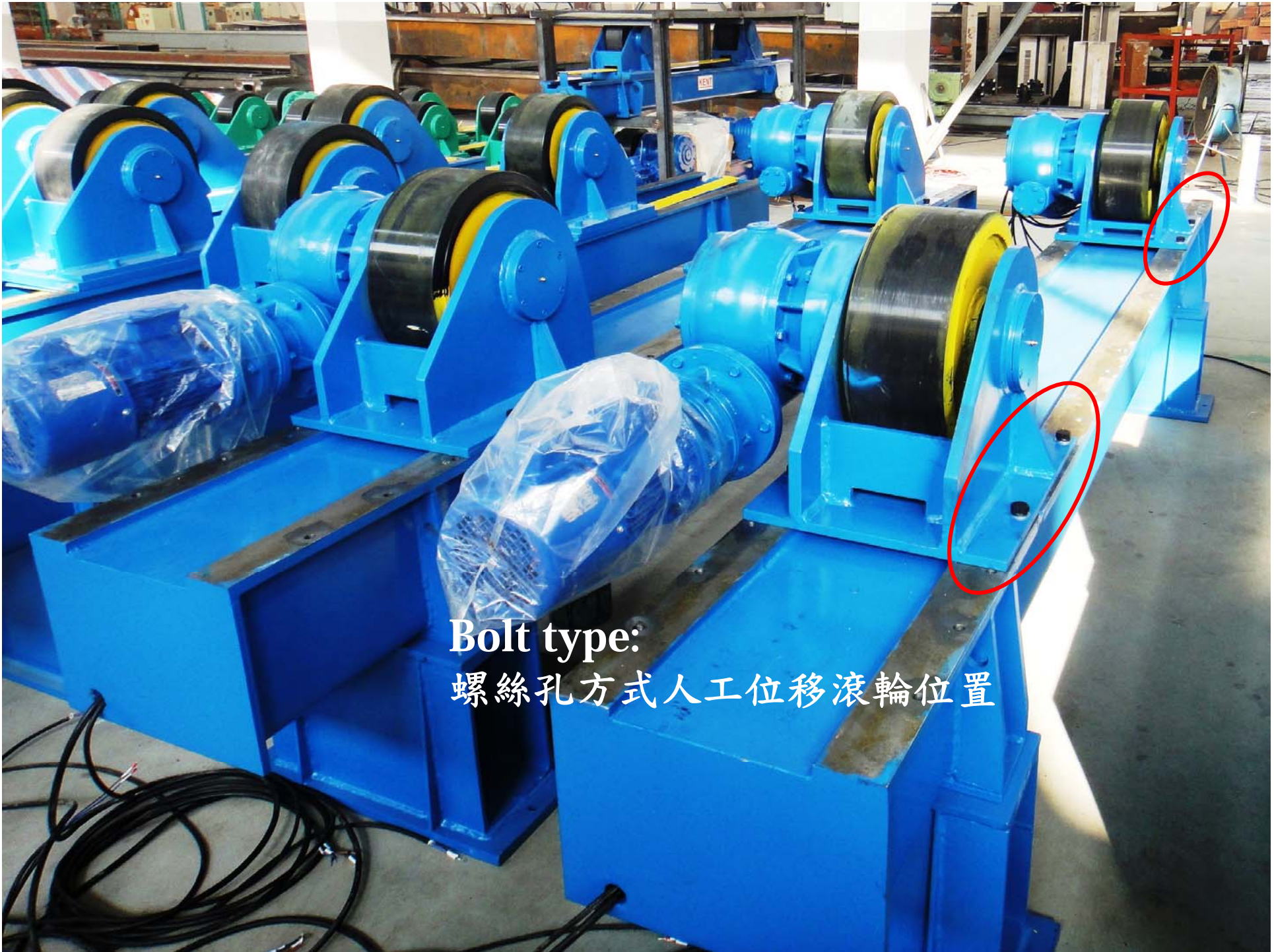
Bolt type: 螺絲孔方式人工位移滾輪位置